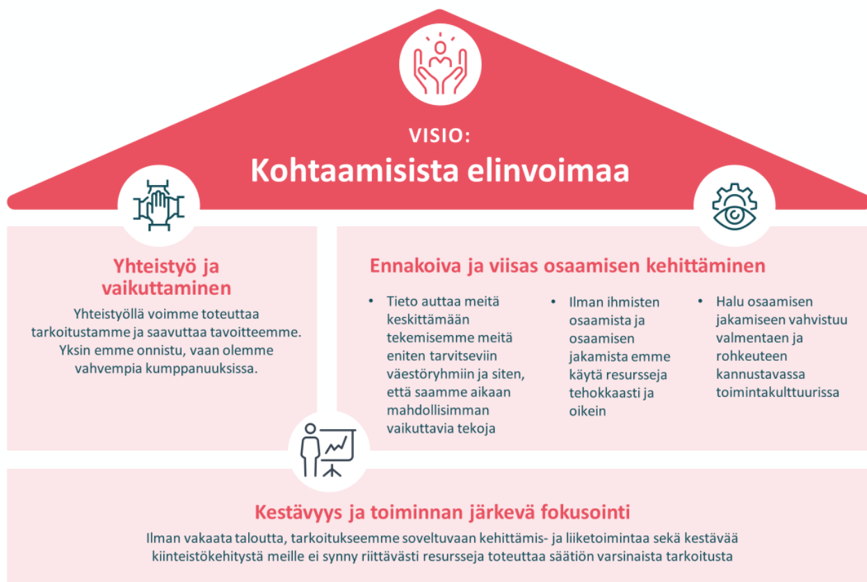
Kuva 1 Strategian painopisteet