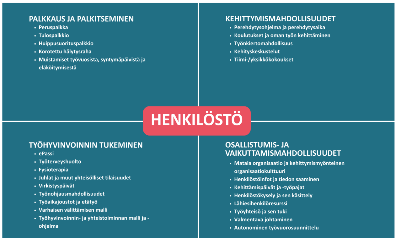
Kuva 2 Henkilöstön hyvinvointi ja kehittäminen

Vuoden 2025 henkilöstökyselyn tulosten perusteella säätiön työntekijöiden työvire on korkealla tasolla ja he ovat motivoituneita ja kokevat työkykynsä hyväksi. Oman työn tavoitteet koetaan pääosin selkeiksi, ja vaikutusmahdollisuuksiin sekä esihenkilöltä ja johdolta saatuun tukeen ollaan varsin tyytyväisiä. Yhteistä työskentelyä näiden asioiden edelleen kehittämiseksi jatketaan vuonna 2026.