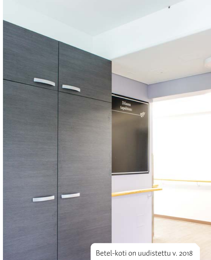
Betel-koti on uudistettu v. 2018