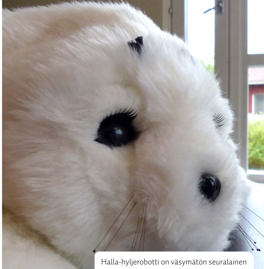
Halla-hyljerobotti on väsymätön seuralainen